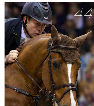
"Roffe" tar med sina bästa hästar till Scandinavium.